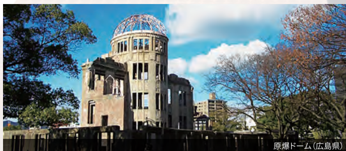
原爆ドーム(広島県)

ダークツーリズム(Dark tourism)とは、災害被災跡地、戦争跡地など、人類の死や悲しみを対象にした観光のことをいいます。 本学では、アジア地域(日本を含む)におけるダークツーリズムについて調査しています。